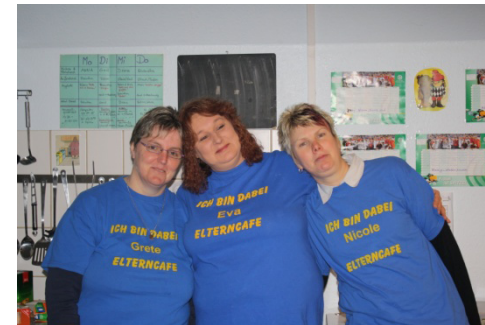
Muttertag in Moordorf am 09.05.2010